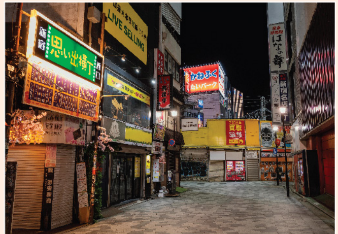
▲ Tesla 創辦人 Elon Musk 早前於 Twitter 上指低生育率將令日本「不復存在」。