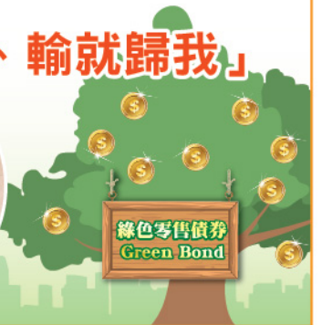
▲葉老闆為慰勞員工於疫情期間的付出，向全體約300名員工提供免按金免利息認購5手綠色零售債券(Green Bond)。