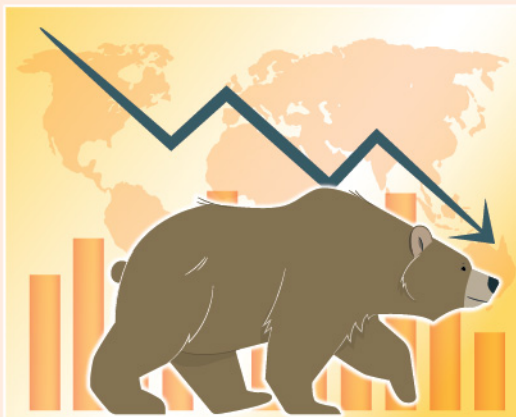
▲ 外圍股市低走，中港兩地股市亦難獨善其身，但以目前恒指之估值水平計，下跌空間仍然相對有限。

隨著外圍股市低走，中港兩地股市亦難獨善其身，即使過去一個月內地不斷有政策出台穩定經濟(包括貨幣政策、內房政策、科技監管鬆綁言論、消費鼓勵政策等)，亦難以抵擋外資撤資的影響。不過，即使恒指至今仍處於浪低於浪之格局，但技術上RSI亦開始出現底背馳之形態，投資者目前可留意指數於後市能否於每月繼續企穩於月線圖250月線之上。筆者始終認為，以目前恒指之估值水平計，下跌空間仍然相對有限。